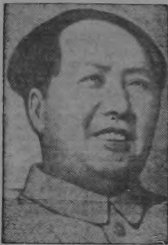
MAO TSE TUNG

NACIONES UNIDAS, 3 (AP) — Una acalorada diatriba de la China Roja da a entender