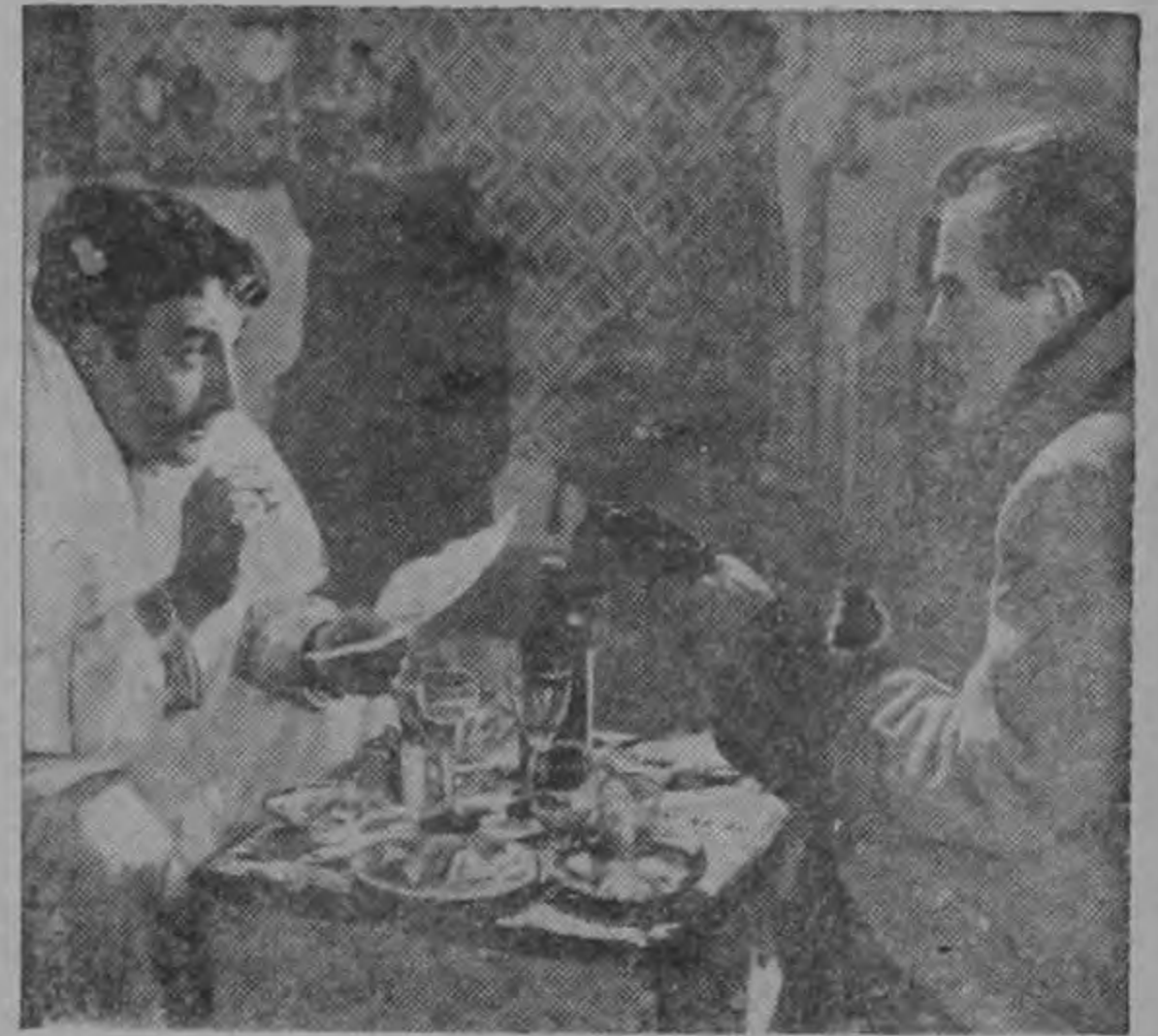
Peter Sellers (como Quilty) trata desesperadamente de persuadir a Humberto (James Mason) de que no lo mate, en una escena de "LOLITA", movido drama donde Shelley Winters interpreta el rol de Carlota y Sue Lyon debuta como Lolita.

Sus adelantos fueron tan rápidos, que en el curso de un mes desempeñó con notable éxito un corto papel en la televisión. Ese corto papel fue para ella la puerta que le dio acceso al templo de la fama. De allí en adelante comenzó a estar en mucha demanda por todos los organizadores de programas televisados, inclusive los de Loreta Young. Sus éxitos fueron