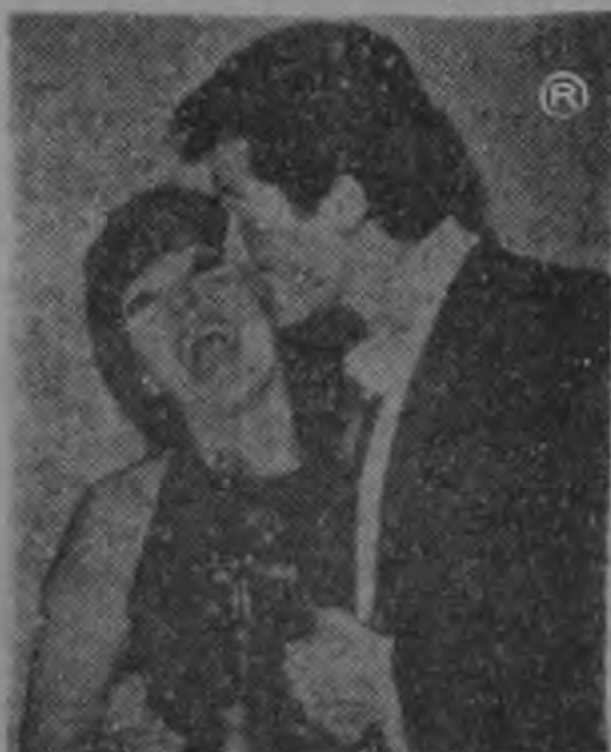
Un beso a Rita Moreno, su gran compañera en Amor sin Barreras, película donde ambos ganaron los codiciados Oscars de la Academia. Pero todo es platónico, pues Chakiris afirma que falta mucho tiempo para que se enamoren.

"Ese es uno de los motivos por los cuales yo detesto los clubes nocturnos. Me sucede con frecuencia que no puedo ver la función debido a que tengo que dedicar todo mi tiempo a firmar autógrafos. Y cuando termina la función siempre hay alguien que espera que yo salga a bailar. No niego que si que me pidan mi autógrafo me halaga en extremo, pero eso le arruina la noche a uno."