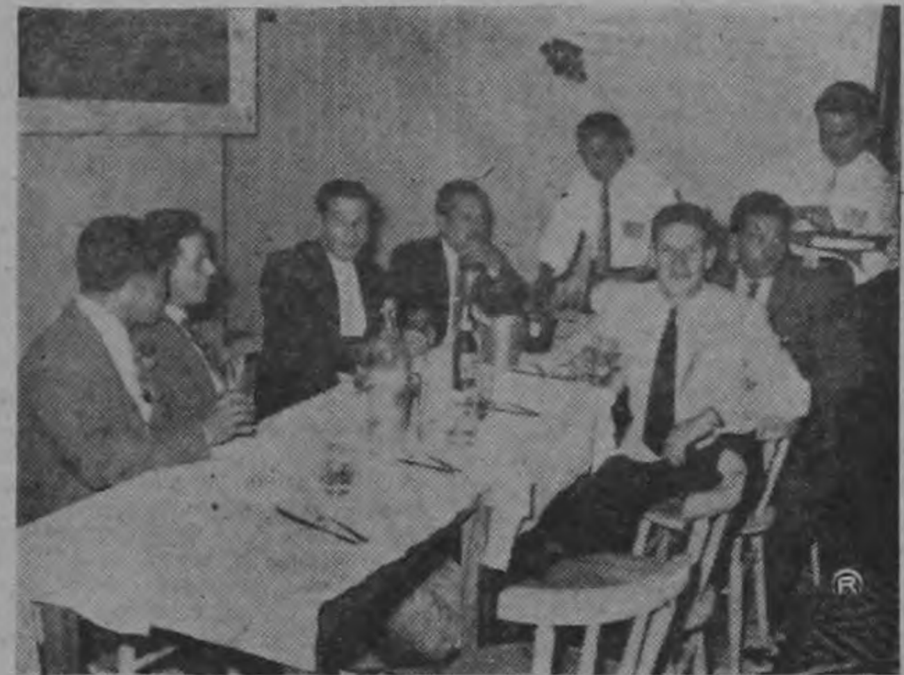
FIESTA DE EMPLEADOS. Un aspecto de la agradable fiesta de fin de año que organizaron los empleados de la prestigiosa firma Kativo S. A. en un salón social en la ciudad de Cartago. La fiesta de Kativo se prolongó durante varias horas en medio de un ambiente de cálido compañerismo.

Ambos deben poseer amplios conocimientos de mecanografía, buena redacción y ortografía y tener experiencia en esas actividades. Dirigirse al apartado 1528 indicando tiempo y lugares en que han trabajado, edad y pretensiones de sueldo.