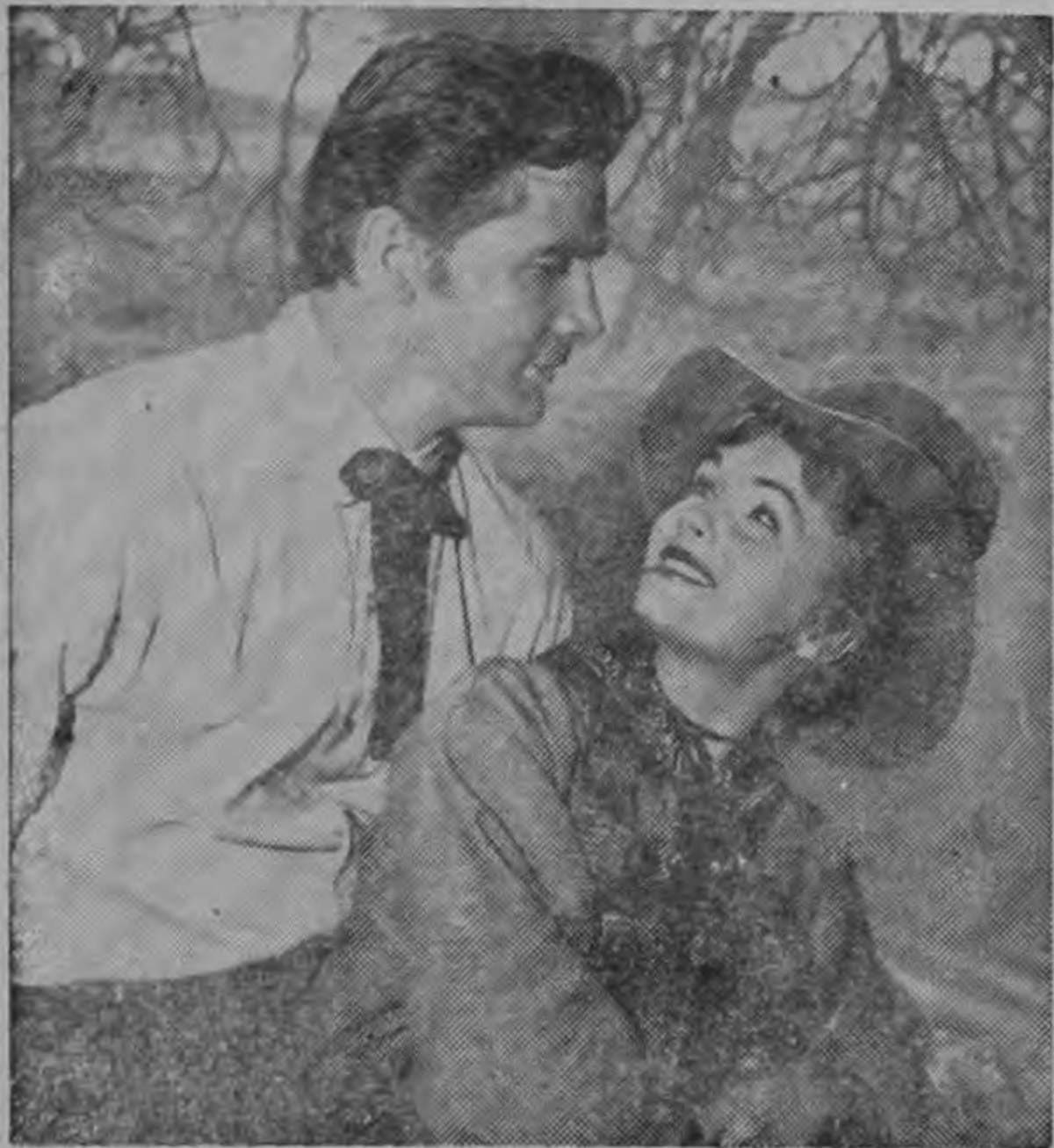
Debbie Reynolds y Andy Griffith, artistas principales de "Ciclón con Faldas", que también tiene en papeles estelares a Steve Forrest, Juliet Prowse, Thelma Ritter y Ken Scott. Es una jocosa parodia de parodias de las películas del Oeste.

Un carnaval de risas, acción y situaciones equívocas es CICLON CON FALDAS.