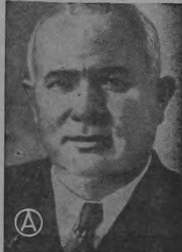
NIKITA KHRUSHCHEV ...Mao pide su expulsión del Partido...

La declaración expresa que los chinos se han visto obligados a intervenir a una discusión pública de las principales diferencias" en las filas comunistas. En el editorial se lanza luego el desafío para la realización de una reunión mundial "a fin de arreglar las actuales diferencias en el Movimiento Comunista Internacional".